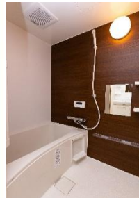
浴室・暖房洗浄機能付便座